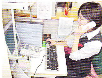
安否確認の「ふれあいコール」