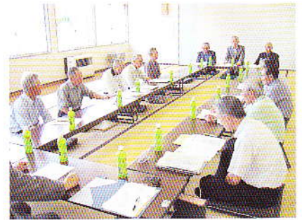
福祉員研修会(内小友地区)