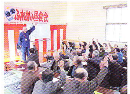
地域支えあい事業(金谷町)